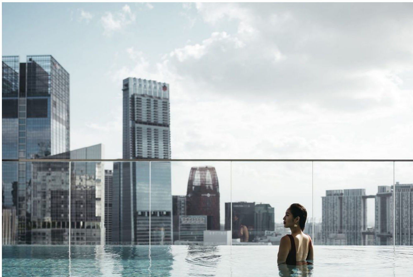
畅游于顶层的空中泳池Sky Pool能俯瞰迷人的城市天际线。

新加坡客安酒店楼高30层，拥有令人赞叹的高空辽阔景观。顶层的空中泳池Sky Pool和24小时健身室Sky Gym专为酒店宾客私享，让人边俯瞰迷人的城市天际线，边尽情放松或挥洒汗水。健身室更设有东方特色的“咏春拳木人桩”，提供由专业教练指导的在线锻炼课程，满足个人的健身需求。